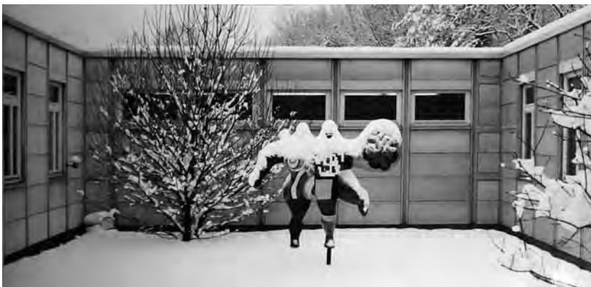
„Nana“-Skulptur der Künstlerin Niki de Saint Phalle im Innenhof der Tumor-Zentrale (1970er Jahre)