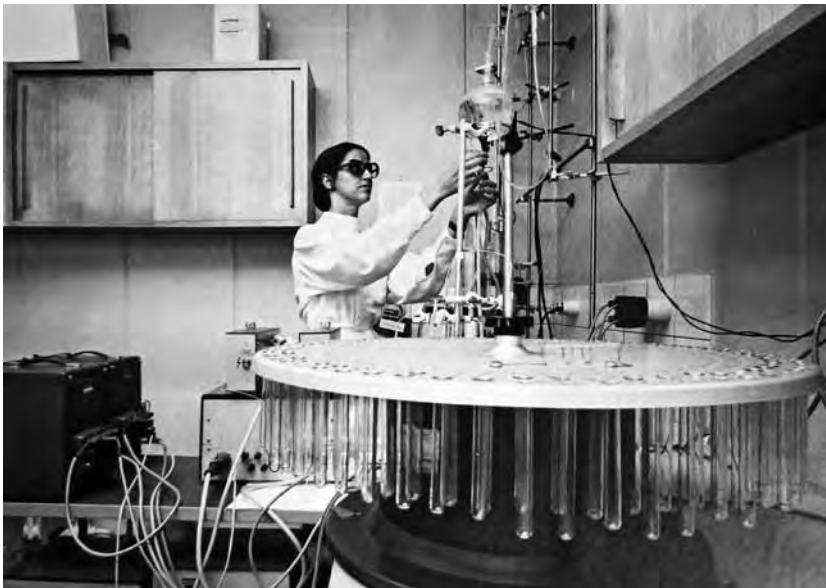
Laborarbeiten im Tumor-Institut

Die verantwortlichen Projektleiter waren durchwegs Naturwissenschaftler und Mediziner. Sieben von ihnen wurden zwischen 1972 und 1986 in Anerkennung ihrer Verdienste für die Tumorforschung von der Medizinischen Fakultät der Universität Bern zu Professoren befördert. Während dieser Zeitspanne haben am Tumor-Institut auch mehr als 20 Studienabgänger als wissenschaftliche Mitarbeiter auf Zeit ihre Dissertation verfasst. Von den Forschern des Instituts sind bis 1988 in internationalen Fachzeitschriften über 250 Publikationen erschienen.